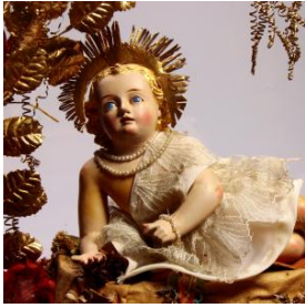
Figura infantil de bulto en posición yacente, cabello dorado y rizado con resplandor dorado. Brazo derecho flectado apoyado en una base que sostiene su cuerpo, el brazo izquierdo doblado hacia adelante con dedo