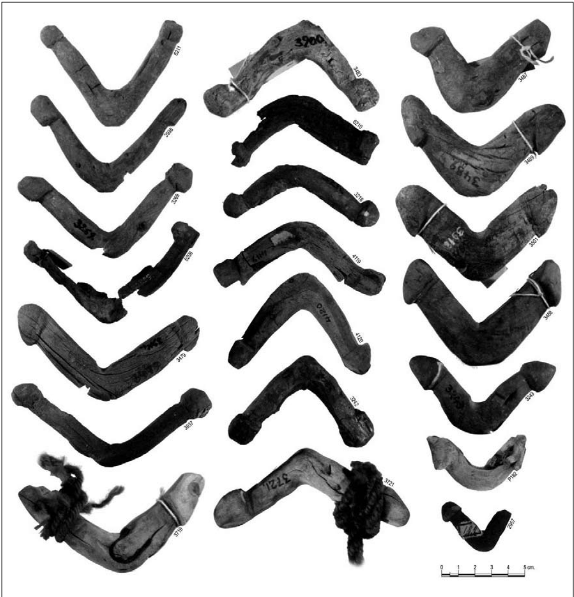
Figura 1. Diferentes formas y tamaños de tarabitas u horquetas de atalaje.

aguzadas (Figura 1). En su gran mayoría se han ejecutado sobre madera y, en una escasa proporción, en hueso. Algunas han sido encontradas con cuerdas o sogas –fabricadas con fibras vegetales o animales–, atadas a sus extremos. La mayor parte de los hallazgos de estas piezas corresponden a sitios pertenecientes a los últimos momentos de desarrollo cultural prehispánico (1000-1470 DC) ubicados en las áreas de Puna y su borde, quebradas altas de Salta y Jujuy y, en menor cantidad, en los valles mesotérmicos del sur.