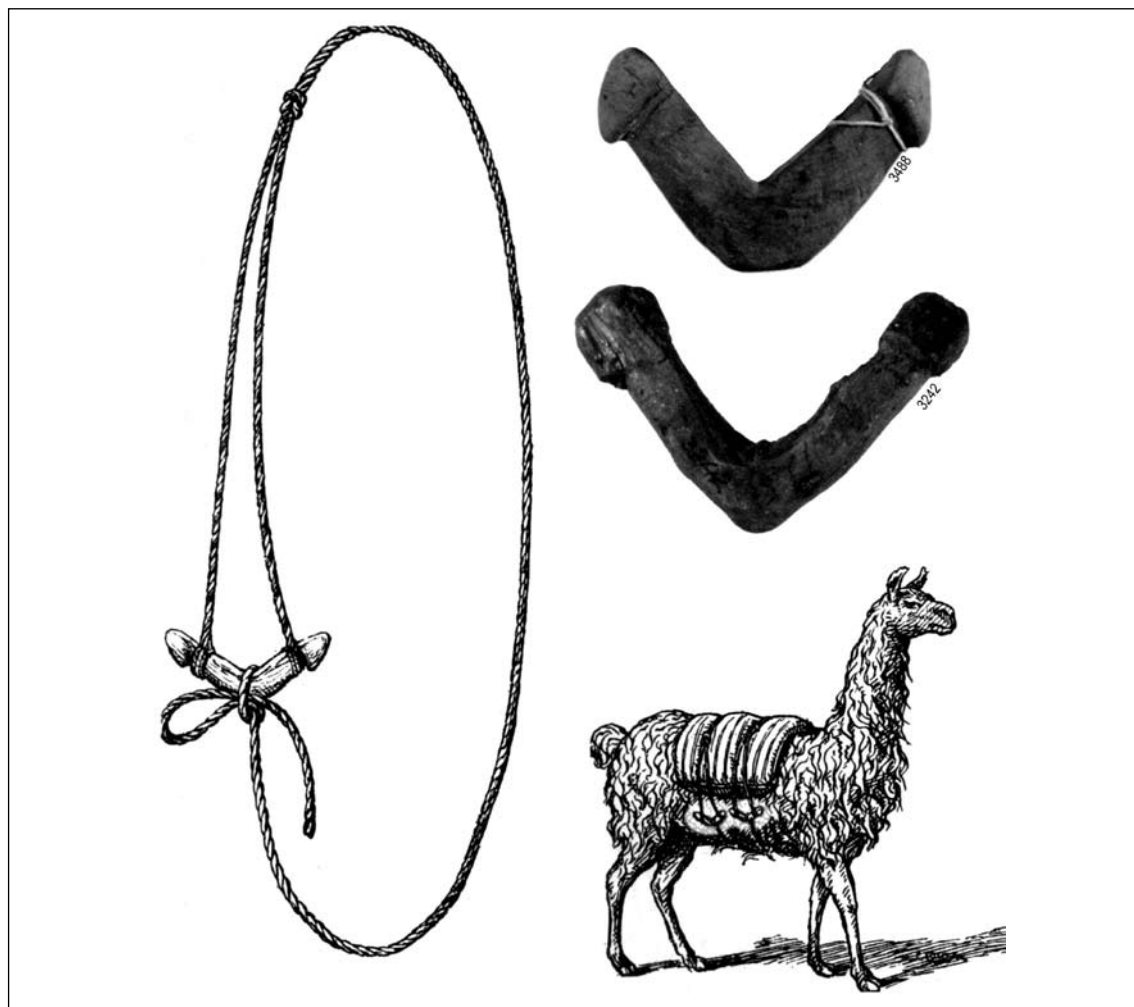
Figura 3. Forma de atar las tarabitas u horquetas. Tomado y modificado de Boman (1908).

“...es imposible que los ganchos hayan sido fabricados especialmente con este fin, pues las cuerdas inmóviles de un paquete que contenía un cadáver no